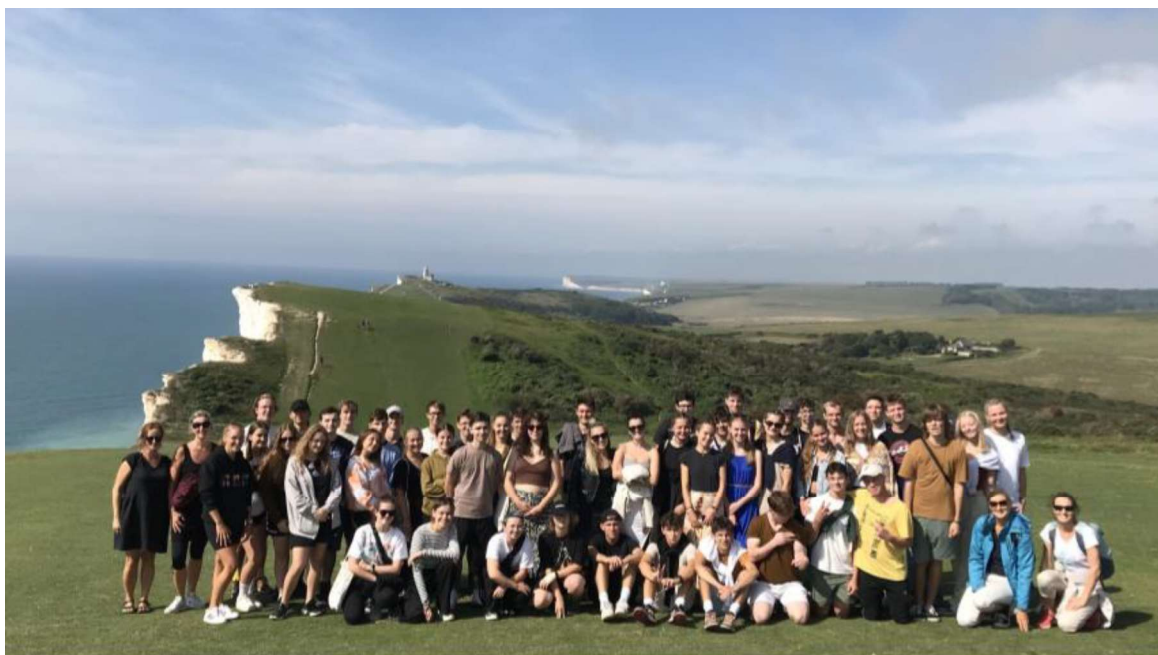
Exkurze třetích a čtvrtých ročníků v Anglii