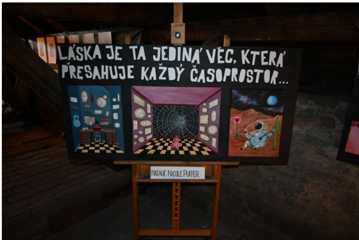
Výstava maturitních prací na půdě gymnázia