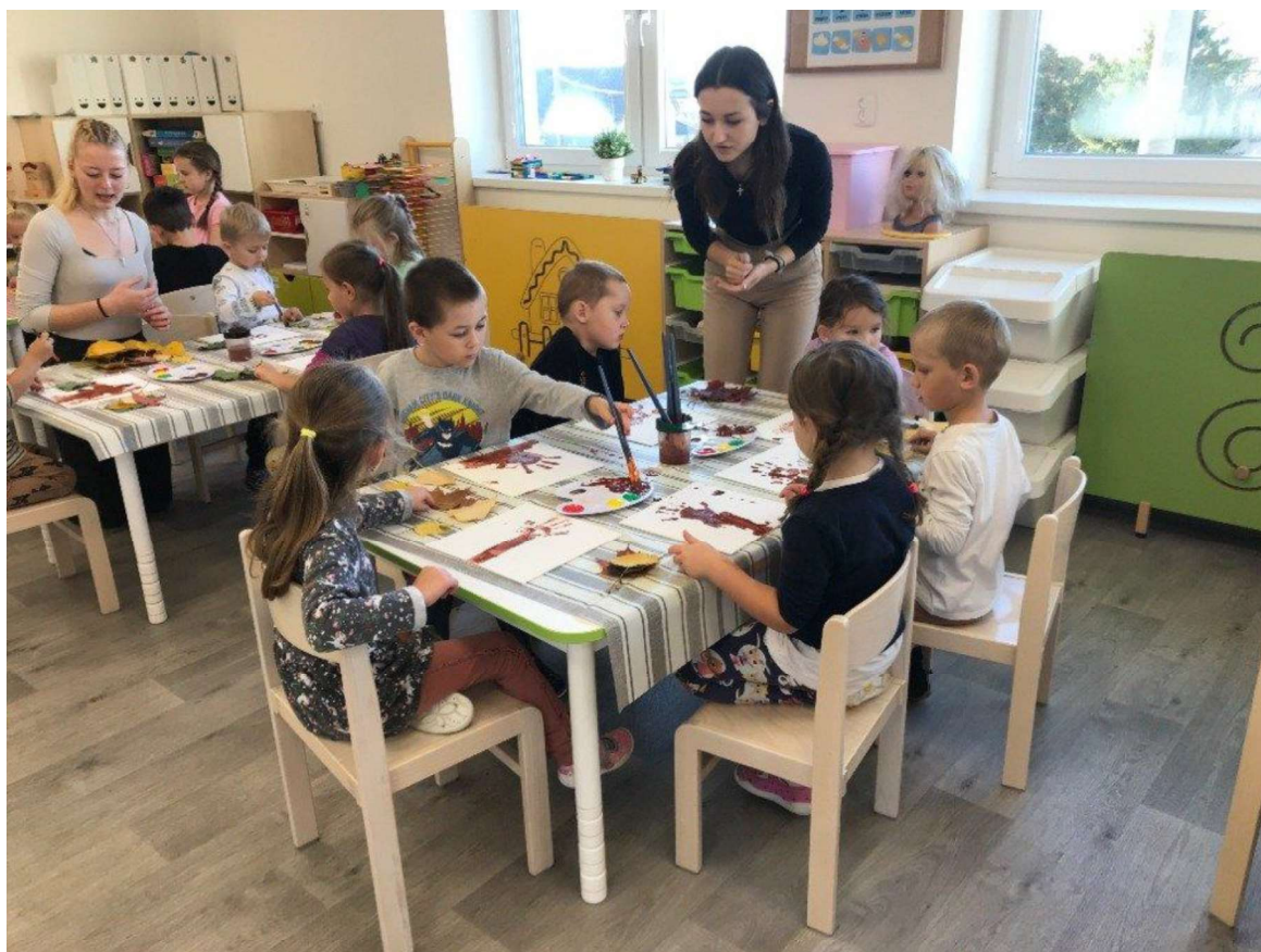
Tvoření v Mateřské škole v Rudě

Studenti naší školy se zapojují do dobrovolnické činnosti. Spolupracujeme zejména s Centrem Kopretina zřizovaného Oblastní charitou Žďár nad Sázavou. Toto centrum připravuje programy pro maminky s dětmi, a navíc v tomto školním roce začalo nabízet tvoření pro mateřské školky. Naše studentky se v průběhu celého roku zapojovaly jako dobrovolnice do organizace těchto akcí. Mohli jste se s nimi setkat v září na Dni zdraví na náměstí, na Mikulášské nadílce, na oslavách Dne Země, které se letos nesly v duchu tématu „Země ve vesmíru“, nebo se s nimi můžete setkat o prázdninách na příměstském táboře.