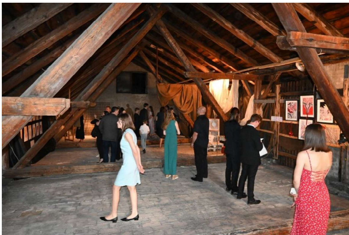
Výstava maturitních prací na půdě gymnázia