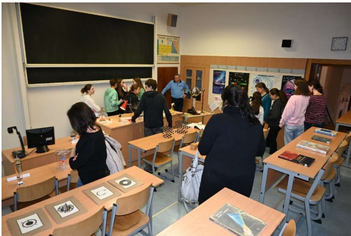
Pokusy v učebně fyziky v rámci Odpoledne otevřených dveří na GVM