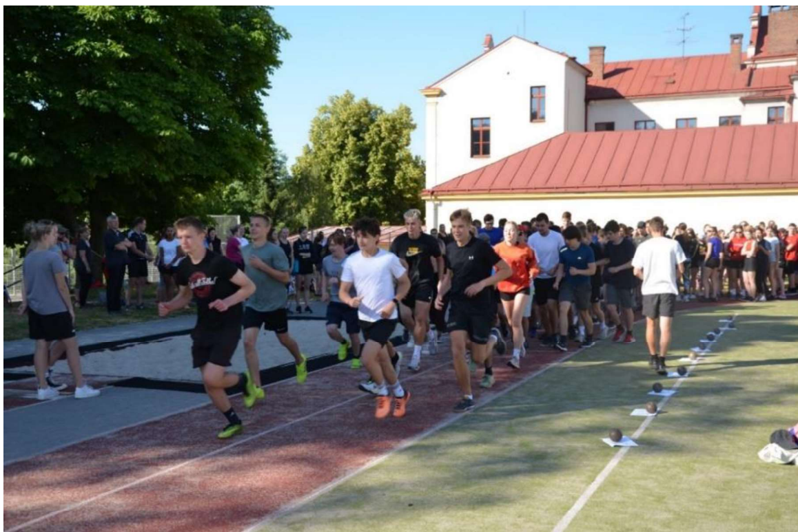
Sportovní den na víceúčelovém hřišti