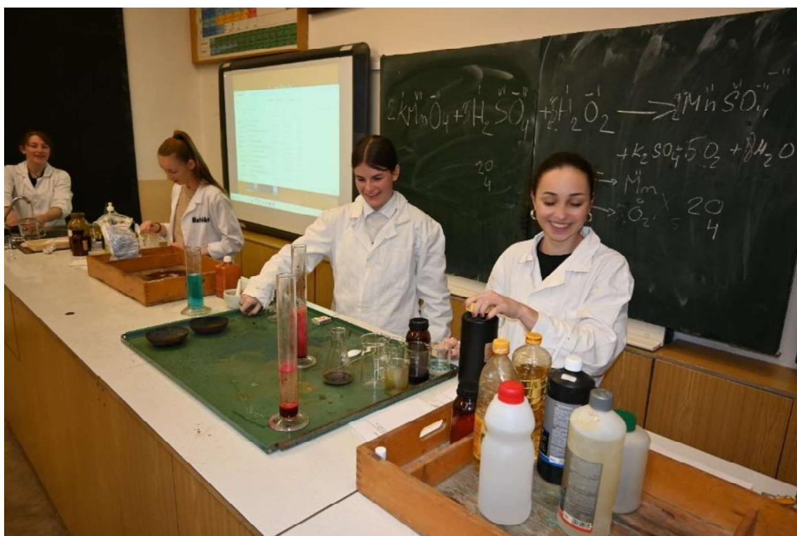
Pokusy v učebně chemie v rámci Odpoledne otevřených dveří na GVM

Během odpoledne vystoupí také náš obnovený pěvecký sbor.