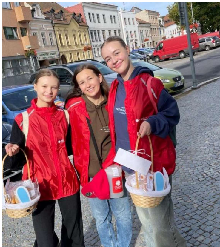
Studentky GVM na charitativní akci