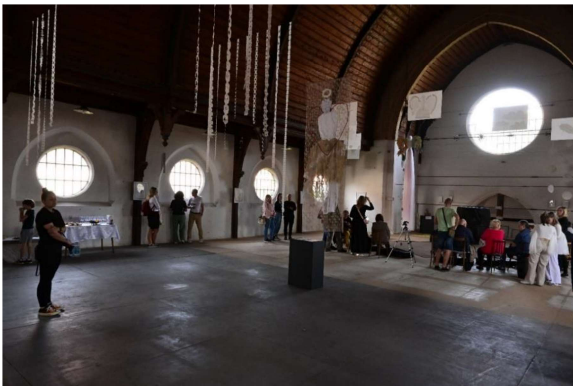
Vernisáž „Andělé a démoni“ v synagoze.