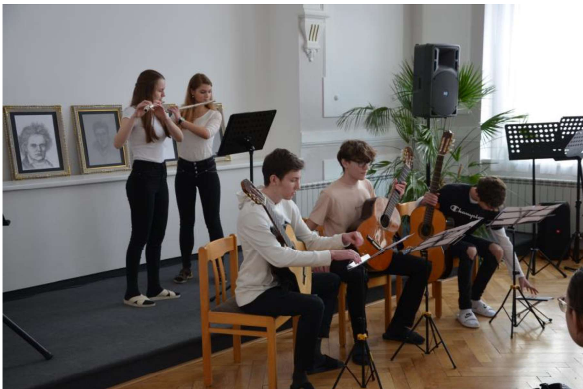
Vystoupení studentů při Evropském dnu hudby