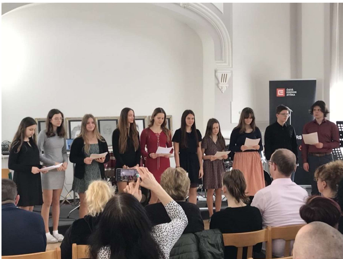
Vystoupení pěveckého sboru GVM na Evropském dnu hudby.